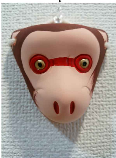
猿田彦神社の二番庚申で猿面を買ってきました。ココラボの玄関に飾ってます。