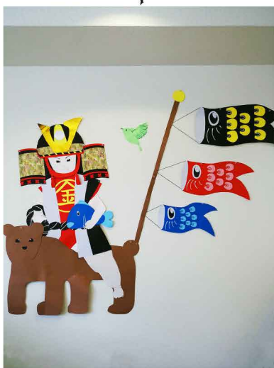
5月は端午の節句ということで、金太郎と鯉のぼりです。